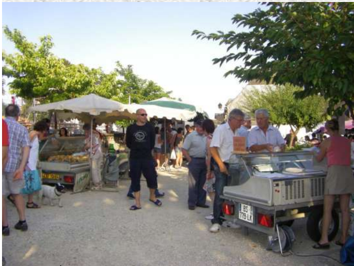
Marché des producteurs