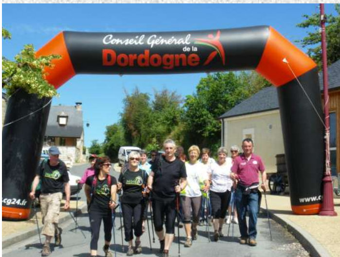
Journée Senior Soyez Sport (activité marche nordique)