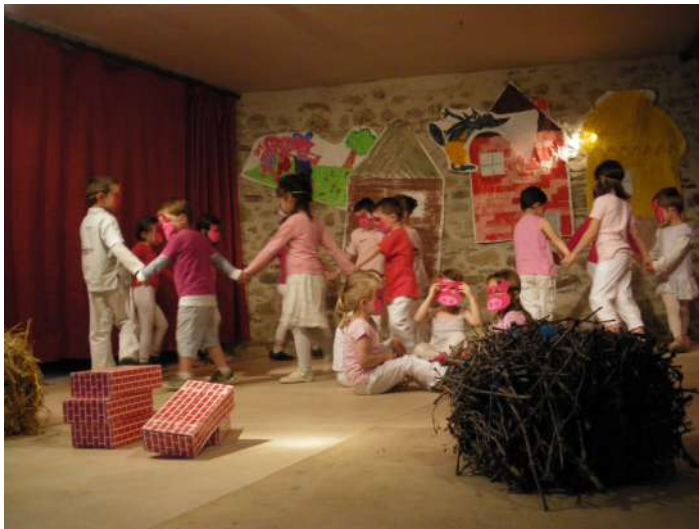
Spectacle des écoles