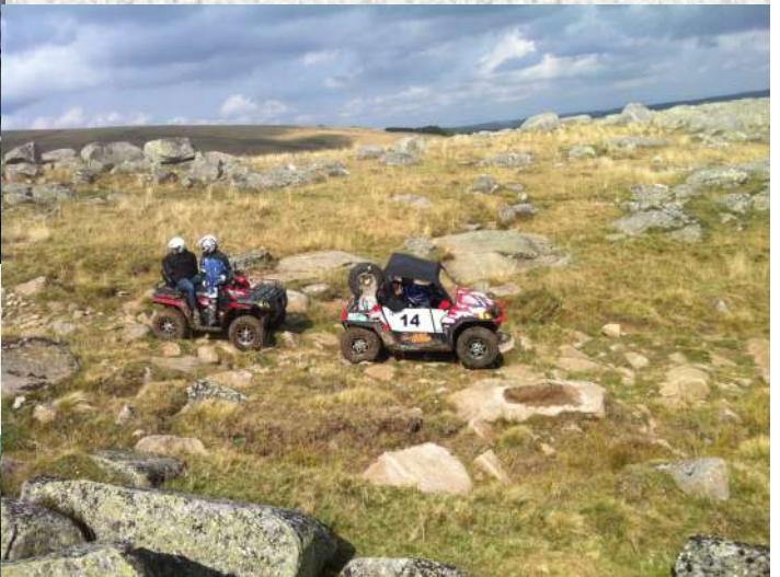
Peyri'Quad en Aveyron