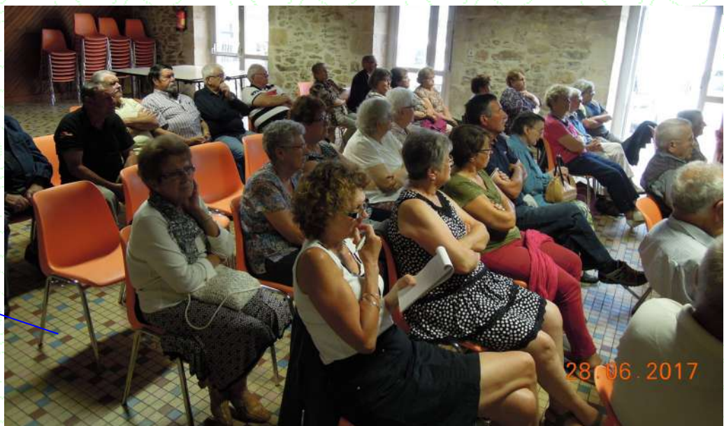
Prévention routière pour le club des aînés