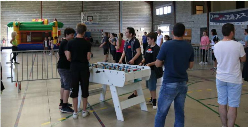
Journée jeux Amicale laïque