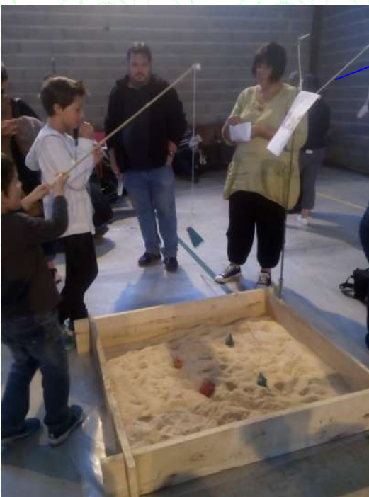
Jeux de la kermesse