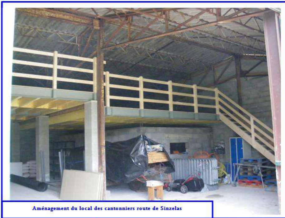
Aménagement du local des cantonniers route de Sinzelas